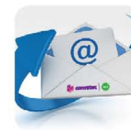
Regularne e-maile z aktualnościami

Regularnie wysyłamy e-maile z przydatnymi wskazówkami i poradami dotyczącymi stylu życia. Jeśli będziesz nas śledzić w mediach społecznościowych, będziemy Cię informować o nowych produktach i wydarzeniach.