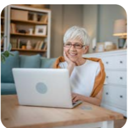
Ciekawe i wartościowe artykuły