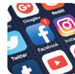
Sieć kontaktów w mediach społecznościowych