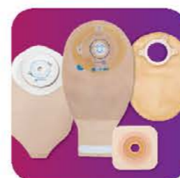
Porady ekspertów dotyczące produktów i bezpłatne próbki