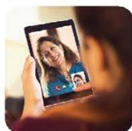
Filmy edukacyjne dotyczące wielu różnych zagadnień