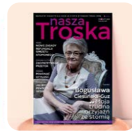
Prenumerata czasopisma dla stomików Nasza Troska