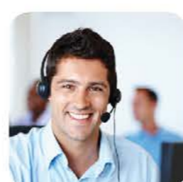
Bezpłatna infolinia, dzięki której uzyskasz odpowiedzi na wszystkie pytania