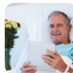
Dostęp do wszystkich materiałów online