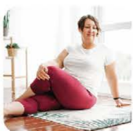
Filmy z ćwiczeniami, które pomogą w powrocie do zdrowia