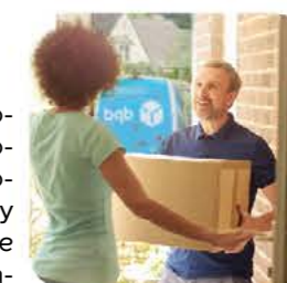
Usługa dostaw do domu

Nasza usługa kurierska dostarczy Ci wszystkie potrzebne produkty bezpośrednio do domu. Wiemy jak ważny jest dla Ciebie sprzęt stomijny - dzięki naszej bezpłatnej, szybkiej i niezawodnej usłudze nigdy nie będziesz się martwić, że go zabraknie.